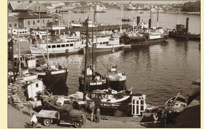
Slik var miljøet rundt kaiene for 60 år siden. Og det var her Hundvåg I, Oscar II, Øybuen og Jøsenfjord gikk fra kai. De kommer igjen til festivalen.