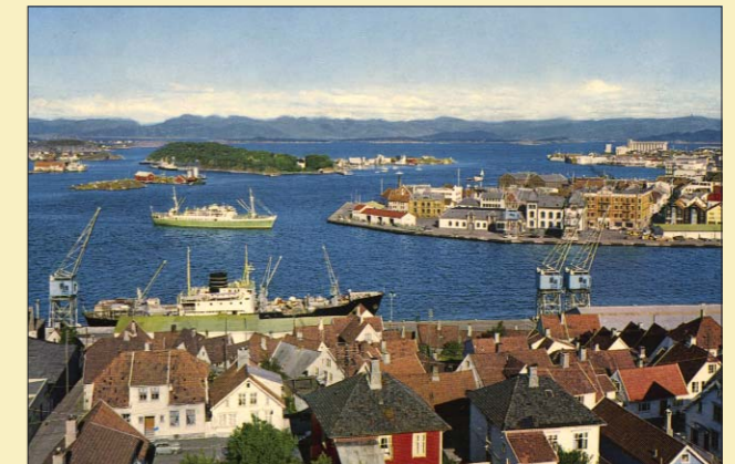
Natrutreskipet MS Sandnes seiler inn Vågen til Skagenkaien i 1950. Igjen å få oppleve under festivalen.