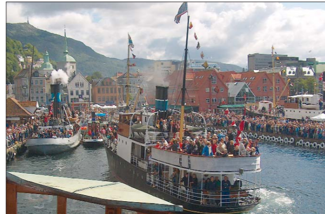
Folk gikk "mann av huse" i Bergen i 2005.