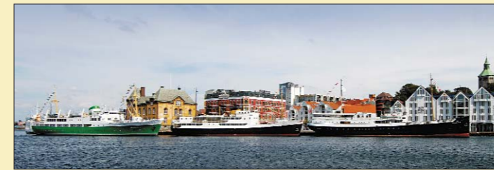
Et historisk flott syn. Bildet viser hvor viktig det er å ta vare på veteranskipene i sitt rette miljø. Det var på Skagenkaien Rogaland og Sandnes betjente byens betydningsfulle sjøfartshistorie.

Stavanger har i flere omganger hatt sjøen som levevei, både direkte og indirekte. Som en av landets ledende sjøfartsbyer har den også en innholdsrik sjøfartshistorie. Enkelte deler av denne historien har vi i Rogaland også klart å ta vare på. Vårt distrikt er godt representert når det gjelder både bredde og tonnasje av kystens seilende minnesmerker. En samling til å være stolt av!