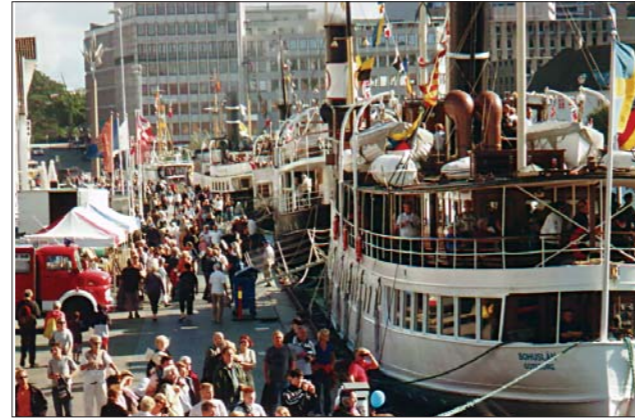
Det ble folkevandring med flotte dampere i Vågen i 2008.

Bergen har arrangert Nordsteam to ganger og begge gangene gikk folk mann av huse med en oppslutning som overgikk selveste Tall Ship Race.