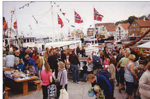
Museene sørget for flere forskjellige aktiviteter for barn og unge.